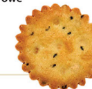
● Crackers with onion & black cumin/ Krakersy z cebulą i czarnuszką