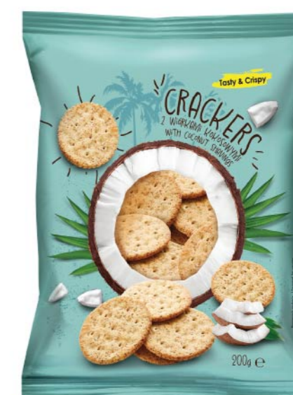
● CRACKERS with coconut shavings/ z wiórkami kokosowymi