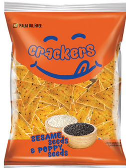
● Sesame crackers/ Krakersy sezamowe