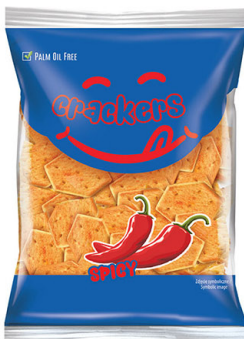
● Spicy crackers/ Krakersy paprykowe