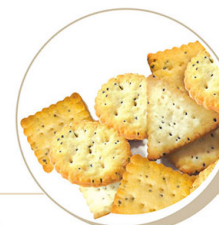
● Crackers with poppy & sesame seeds/ Krakersy makowo -sezamowe