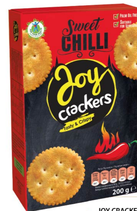
● JOY CRACKERS Sweet Chilli/ z chilli