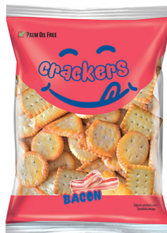
● Bacon crackers/ Krakersy bekonwe