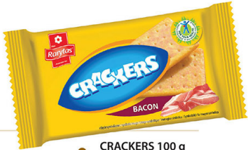
● CRACKERS 100 g bacon/ bekonowe