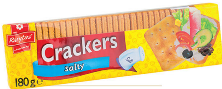
● CRACKERS 180 g salty/ solone