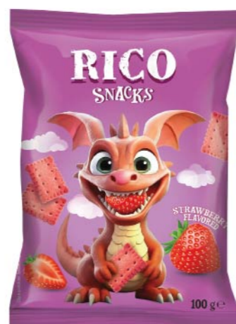
● RICO SNACKS strawberry flavoured/ o smaku truskawkowym