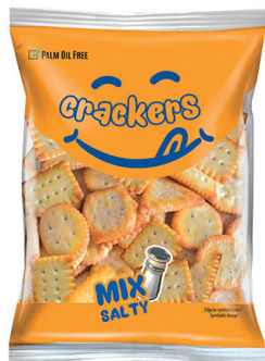
● Salty crackers mixed/ Krakersy mix słony