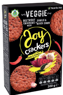
● JOY CRACKERS with beetroot, garlic & black cumin/ z burakiem, czosnkiem i czarnuszką