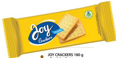
● JOY CRACKERS 180 g classic/ solone