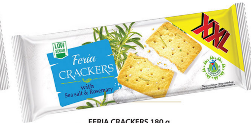
● FERIA CRACKERS 180 g with sea salt & rosemary/ z solą morską i rozmarynem