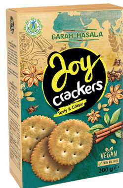
● JOY CRACKERS flavored garam-masala/ o smaku garam - masala