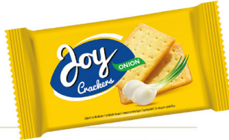
● JOY CRACKERS 100 g onion/ cebulowe