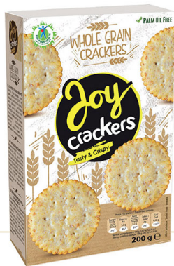
● JOY CRACKERS wholegrain/ pełnoziarniste