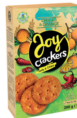
● JOY CRACKERS with chili & orange flavor/ o smaku chilli z pomarańczą