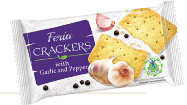
● FERIA CRACKERS 100 g with garlic & pepper/ z czosnkiem i pieprzem