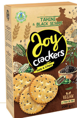
● JOY CRACKERS with tahini & black sesame/ z tahini i czarnym sezamem