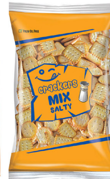
● Salty crackers mixed 400 g/ Krakersy mix słony