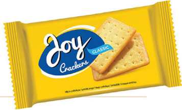
● JOY CRACKERS 100 g classic/ solone