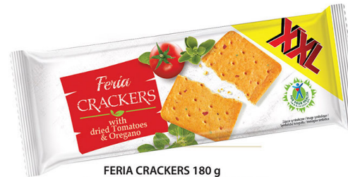
● FERIA CRACKERS 180 g with dried tomatoes & oregano/ pomidorami & oregano