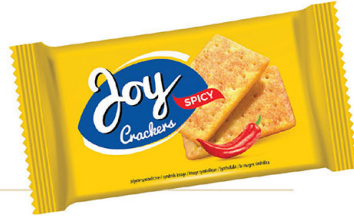
● JOY CRACKERS 100 g spicy/ pikantne