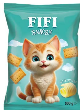
● FIFI SNACKS with butter/ maślane