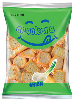
● Onion crackers/ Krakersy cebulowe