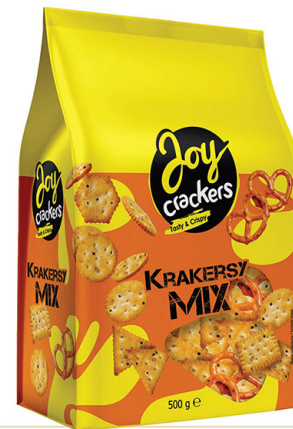
● Crackers with poppy & sesame seeds & pretzels 500 g / Mieszanka krakersów makowo-sezamowych z prelelem