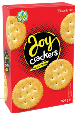
● JOY CRACKERS classic/ solone