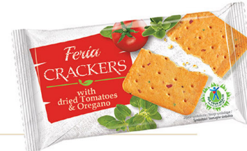
● FERIA CRACKERS 100 g with dried tomatoes & oregano/ pomidorami & oregano