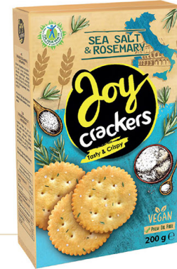
● JOY CRACKERS with sea salt & rosemary/ z solą morską i rozmarynem