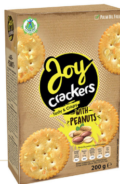
● JOY CRACKERS with peanuts/ z orzechami