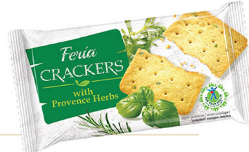
● FERIA CRACKERS 100 g with provence herbs/ z ziołami prowansalskimi