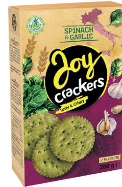
● JOY CRACKERS spinach crackers with butter & garlic/ szpinakowe o smaku masła z czosnkiem