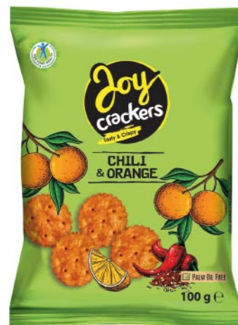
● JOY CRACKERS with chili and orange flavor/ o smaku chili z pomarańczą