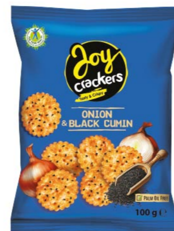
● JOY CRACKERS onion crackers with black cumin / cebulowe z czarnuszką