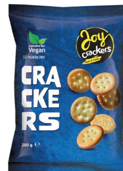
● JOY CRACKERS classic / solony