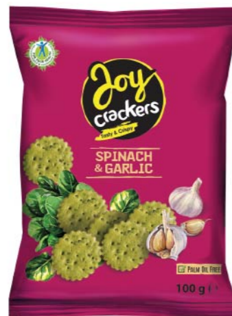
● JOY CRACKERS spinach & garlic/ szpinakowe z czosnkiem