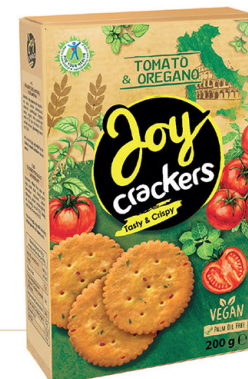
● JOY CRACKERS with dried tomatoes & oregano/ z suszonymi pomidorami i oregano