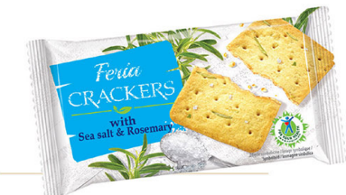
● FERIA CRACKERS 100 g with sea salt & rosemary/ z solą morską i rozmarynem