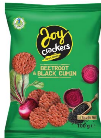
● JOY CRACKERS beetroot & black cumin/ burak z czarnuszką