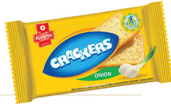
● CRACKERS 100 g onion/ cebulowe