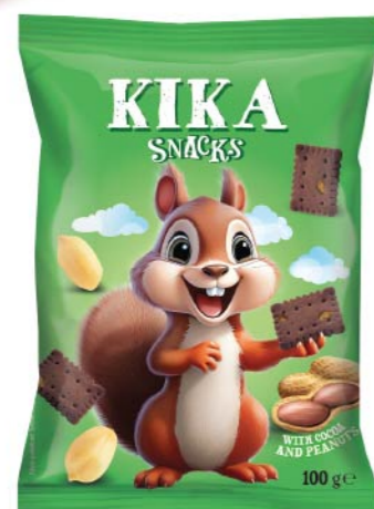
● KIKA SNACKS with cocoa and peanuts/ z kakao i orzechami arachidowymi