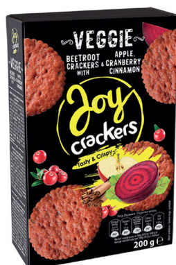
● JOY CRACKERS with beetroot, apple, cranberry & cinnamon/ z burakiem, jabłkiem, żurawiną i cynamonem